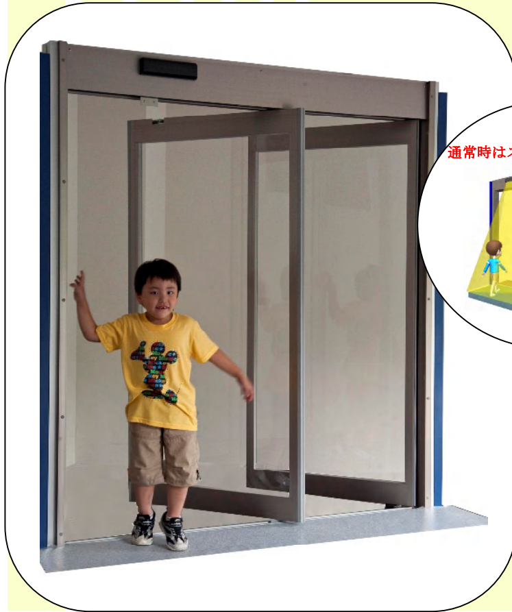
通常時はスライド自動ドア

スライド自動ドアにスイングオープン機能と停電時開放機能をプラスしたブレイクアウトドアシステム